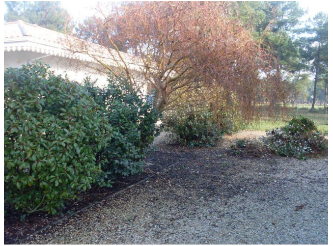
Un Saule qui pleure... une équipe qui rit...