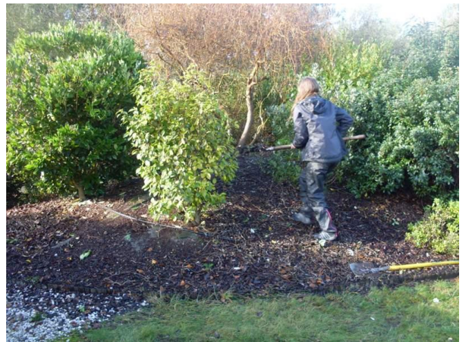
Pauline E. en action