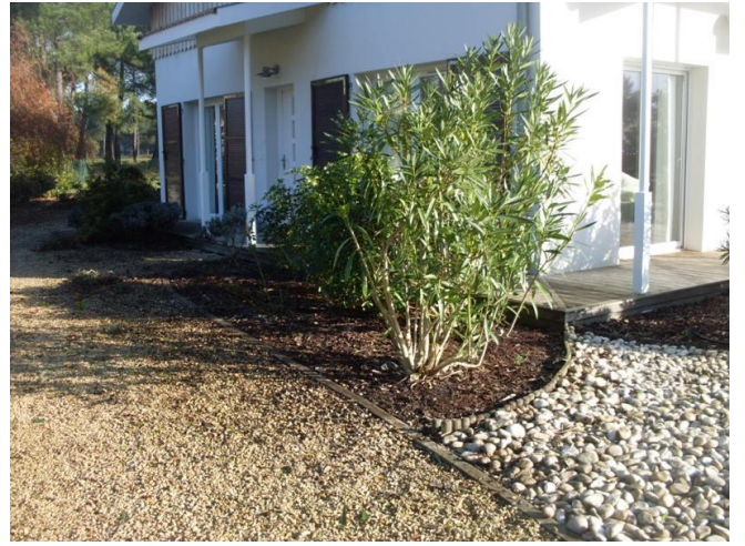
Résultat après 4 heures de dur labeur