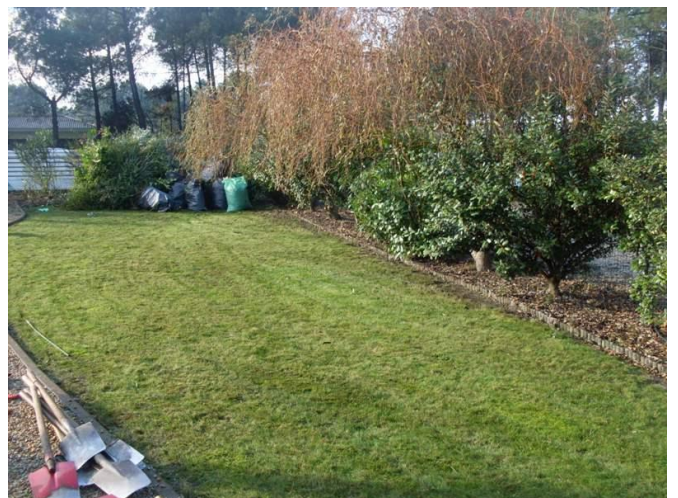
PRECISION-SOUPLESSE-Eymeric dompte la bête pour un résultat qui frôle la perfection