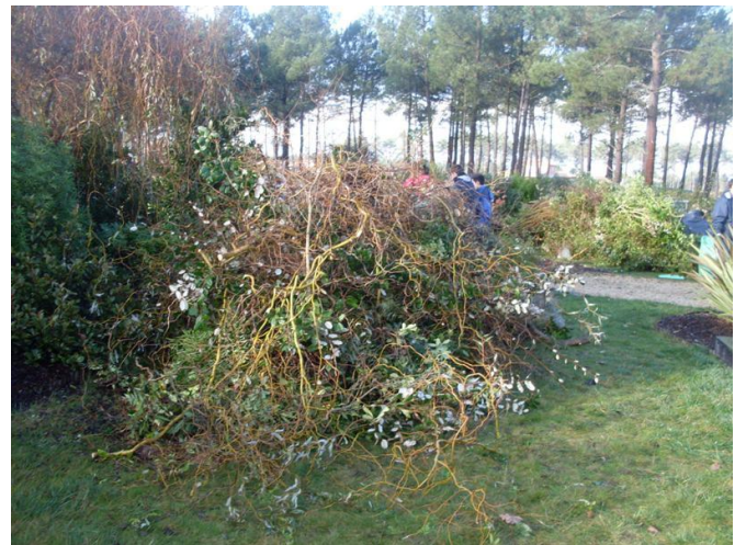
4 m 3 de déchets et rémanents de taille et d'élagage... Bon courage !